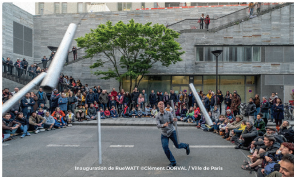
Inauguration de RueWATT

une offre foisonnante et éclectique reflétant toutes les diversités des expressions, des écritures et des formes artistiques.